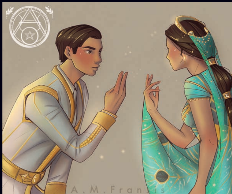
Illustration: A M Fransis

Hej illustratör! Vill du också få dina bilder publicerade i Word? Hör av dig!