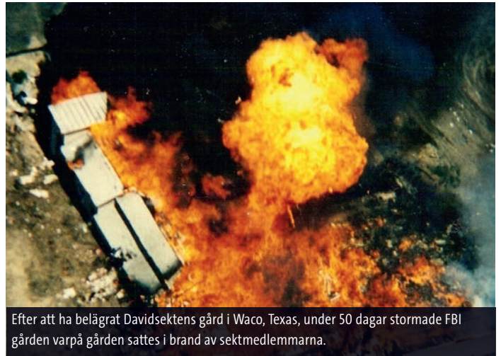
Efter att ha belägrat Davidsektens gård i Waco, Texas, under 50 dagar stormade FBI gården varpå gården sattes i brand av sektmedlemmarna.

900 människor dog och det är oklart hur många som gjorde det frivilligt. Det räknas som den största förlusten av civila amerikaner innan terrorattentaten 11 september 2001.