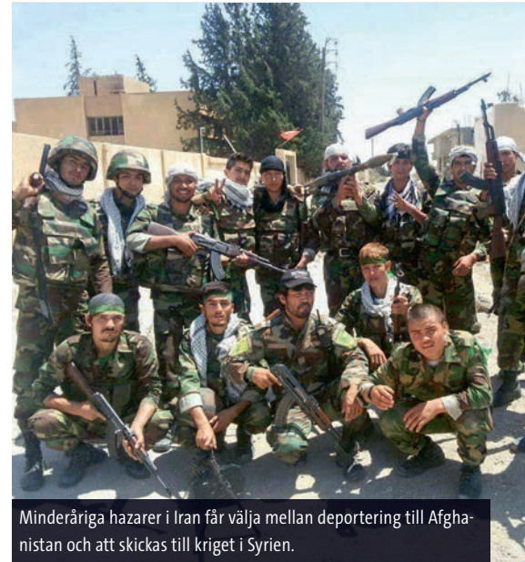
Minderåriga hazarer i Iran får välja mellan deportering till Afghanistan och att skickas till kriget i Syrien.