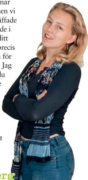
Alva Spångberg om när en ung dör

Våra små liv snurrar vidare, men du kommer alltid att vara den första som försvann. Alla pratar fortfarande om dig. Jag vet att du hade gillat det.