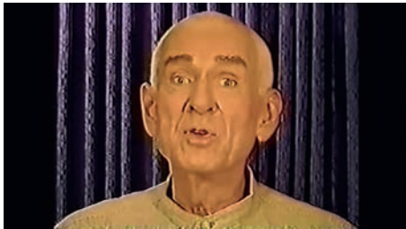
Marshall Applewhite, helgalen medgrundare av och ledare för Heaven's Gate-sekten.