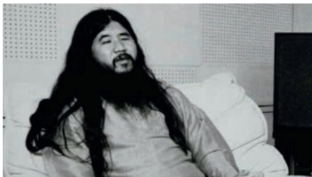
Shoko Asahara, ledare för Aum Shinrikyo.

Då de trodde att jorden var på väg att förnya sig själv helt var enda möjligheten att överleva att resa vidare så fort som möjligt. Trots att gruppen sade att de var starkt emot självmord så var det genom massjälvmord som sekten fick sitt slut 1997.