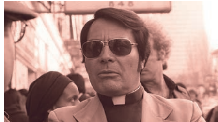
Jim Jones, grundare och ledare för Folkets tempel begick självmord tillsammans med 900 anhängare.

Trots att kulten förutspådde jordens undergång för 19 år sedan (och helt uppenbarligen hade fel) så är den fortfarande aktuell då den har cirka 2000 medlemmar än idag!