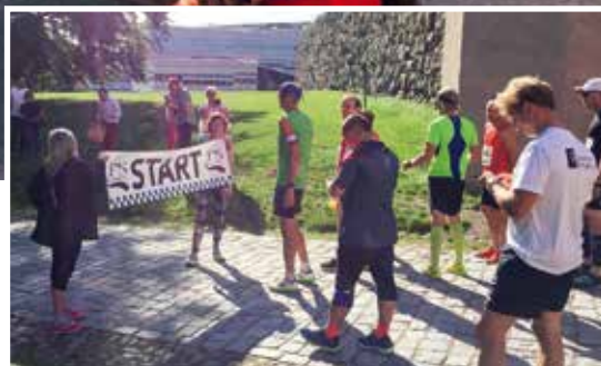
Deltagarna i Kulturmaraton på väg mot start.