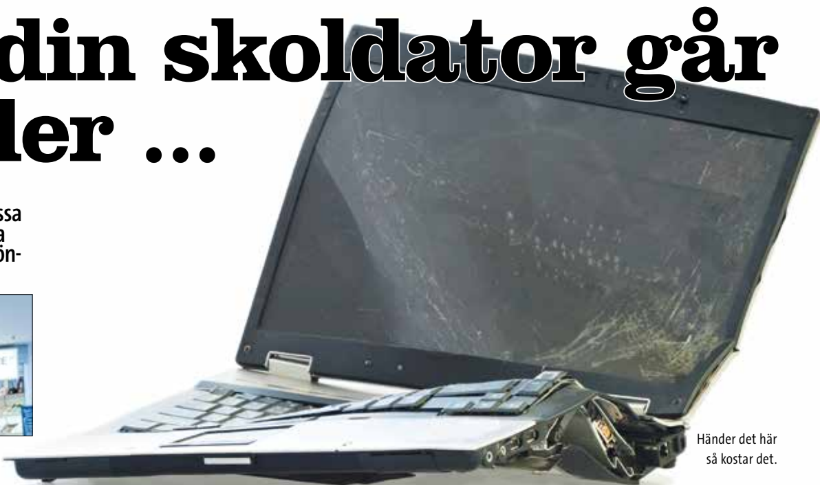
Händer det här så kostar det.

SKOLINSPEKTIONENS EGNA UTTLADE om att “rätten till en likvärdig utbildning av hög kvalitet aldrig får vara beroende av en enskild individs ekonomiska förutsättningar” lämnar en hel del frågetecken efter sig, som hur vi ska fortsätta kunna ha en jämlik skola utifrån elevernas olika ekonomiska förutsättningar?